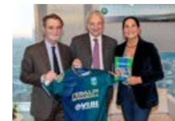
Il presidente Pasini con il Governatore Fontana con la maglia e durante l'incontro